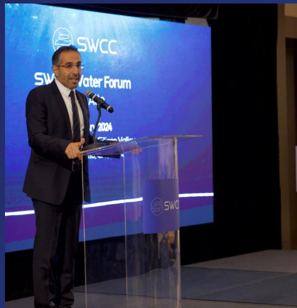
Palo Alto 2024年1月31日