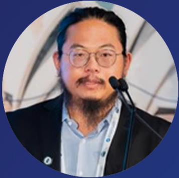
Quantum Wei 影响奖 消耗品和化学品